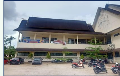
Ruang Ranap Kls 2 (Lt.2) Ruang Isolasi (Lt.1)