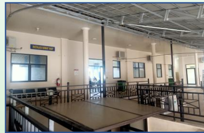
Ruang Ranap Kls 3 (Lt.2)