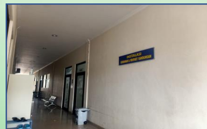
Ruang Kebidanan & Penyakit Kandungan (Lt.2)